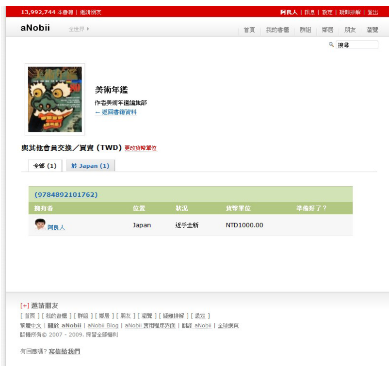
圖 5 aNobii 網站賣書的訊息