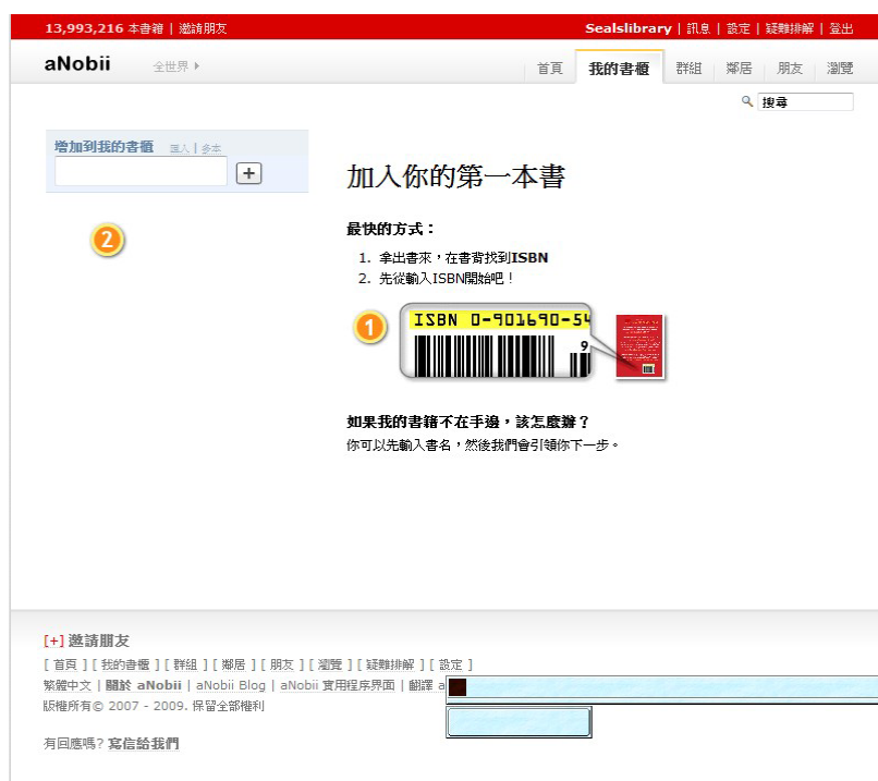
圖 2 aNobii 網站 使用 ISBN 加入書籍

如果你在「書庫」搜尋到了想要找的文獻，我們會恭喜你，恭喜你節省了重新建檔的時間，請好好的使用這筆文獻，或者再把它編輯的更完整。如果不到文獻，我們仍然要恭喜你，學界正需要你建立這筆資料，為自己也為別人，希望你能快速又正確建立好這筆資料。