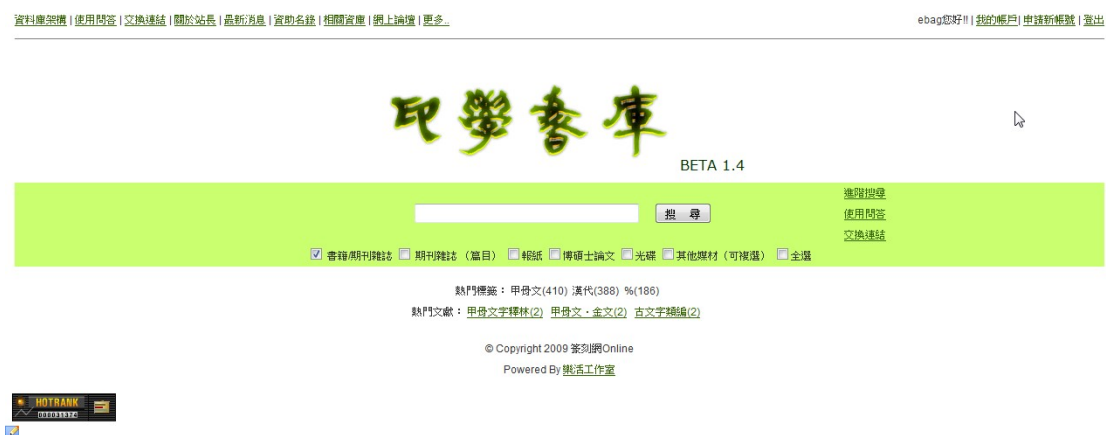
圖 1 新〈印學書庫〉首頁 ( http://www.mebag.com/book )

當書目管理軟體協助個人彙整、管理的功能加強時，彙整與記錄使用者整體資訊尋找或使用行為的能力提升，書目管理軟體可運用的價值也將大為增加，可以刺激研究、資訊需求，書目的分享也將帶動知識地圖的交流，另一種無形學院的形成，在管理與分享的過程中，拓展圖書館資源的利用，帶動學術研究風氣，不正也回歸到圖書館建立與服務的宗旨，故書目管理軟體的應用與改進，中文市場的開發是大家所期待的，另外在加值服務的趨勢引領下，書目資料的分析，書目管理軟體結合記錄檢索歷史，儲存檢索策略等功能，將大為契合與拓展資訊使用行為與需求。 4