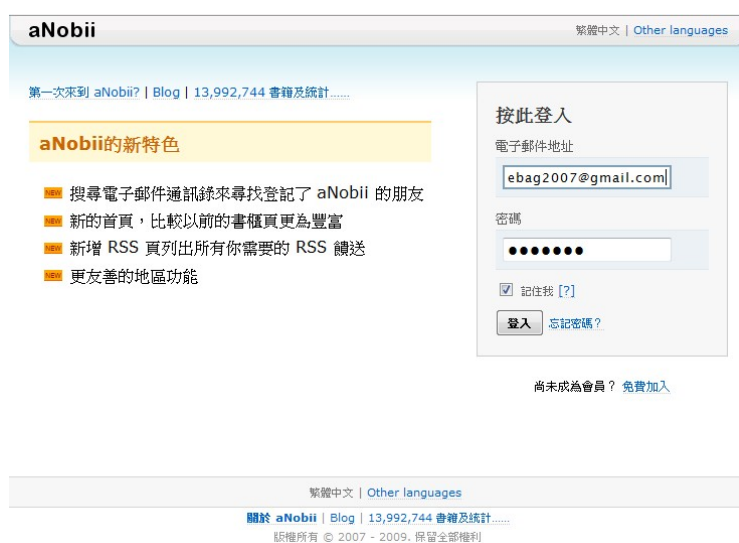
圖 3 aNobii 網站登錄畫面

Anobii (www.anobii.com) 2006 年由宋漢生創立，管理網站時年僅 27 歲。宋漢生說，網站與 Amazon (亞馬遜網上書店) 完全不同，網友進來是為了交流，不一定要買書。網站會與各地書店或網上書店合作，提供新書資料讓網民查詢，故 aNobii 與書店不是競爭關係，而是互相補足。網友除了有份評書，當想買書時，就可按一下書櫃頁的連結，到當地的網上書店購物，aNobii 再從中抽取仲介費用。該網站開設最初半年，用戶只有 5 萬人，至今已增長超過 40 萬人。 7