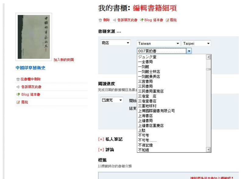
圖 6 aNobii 網站 台北書店的地點選擇

在書籍管理方面，若選擇「整批編輯」，可對書籍作「公開、私人」及「閱讀進度」（未開始、閱讀中、已讀完、未讀完、已丟棄的、參考書）「評分」（十分喜歡、還不錯、普普通通、很後悔）。